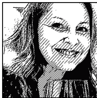
ISA PUBLICITARIA LA OTRA MITAD DE LOS VINOS BONITOS