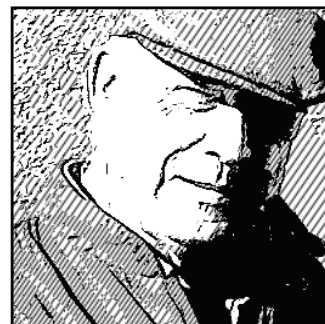
RAFA BUEN AMIGO BODEGUERO

WWW.LOSVINOSBONITOS.ES | @LOSVINOSBONITOS C° DE EL TIEMBLO | SAN MARTÍN DE VALDEIGLESIAS