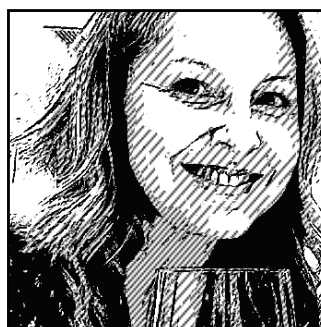
ISA PUBLICITARIA LA OTRA MITAD DE LOS VINOS BONITOS